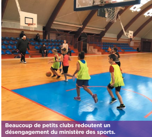
Beaucoup de petits clubs redoutent un désengagement du ministère des sports.

Voulu par le général de Gaulle, ce modèle, envié dans le monde entier, a permis l'éclosion de grands champions, dans quasiment toutes les disciplines. « Sans lui, je ne serais jamais devenue championne olympique », reconnaît ainsi l'Amandinoise Cécile Novak . Je suis issue d'un milieu ouvrier, avec