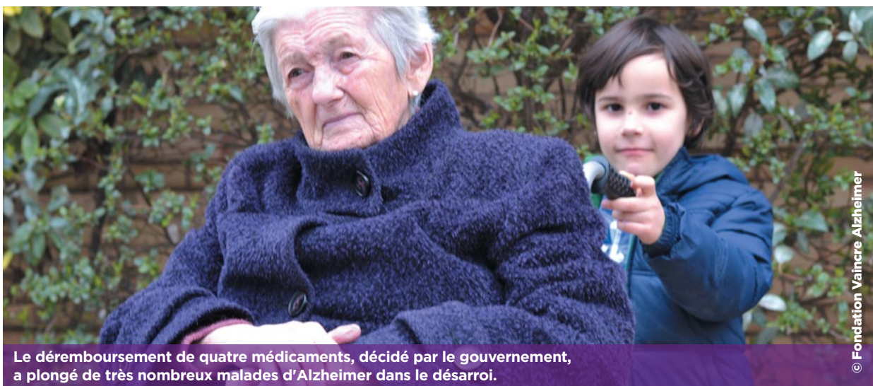
Le déremboursement de quatre médicaments, décidé par le gouvernement, a plongé de très nombreux malades d'Alzheimer dans le désarroi.

Au nom d'arguments contestés par de nombreux spécialistes, le gouvernement a ordonné l'arrêt, à partir du 1er août 2018, du remboursement de quatre médicaments prescrits pour remédier aux effets de la maladie d'Alzheimer. Prise en réalité pour des raisons purement économiques, cette mesure a plongé de très nombreux malades dans le désarroi. Environ trois millions de personnes sont directement ou indirectement touchées par la maladie en France, avec près de 225 000 nouveaux cas diagnostiqués chaque année.