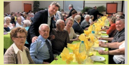
Les banquets des aînés ont réuni beaucoup de monde, comme ici, à Nivelle, au cours desquels les retraités aiment se retrouver, danser et passer un bon moment de convivialité.

Comme prévu, l'Union européenne a refusé la fusion entre Alstom et Siemens. Il faut maintenant travailler à un vrai « Airbus du rail », avec un Groupement d'intérêt économique associant les États et les industriels. C'est de cette manière, et non par des rapprochements purement capitalistiques, que l'on pourra impulser un grand plan de développement du fret ferroviaire en Europe pour relever le défi écologique. La Banque centrale européenne jouerait pleinement son rôle en finançant à taux zéro une telle démarche industrielle.